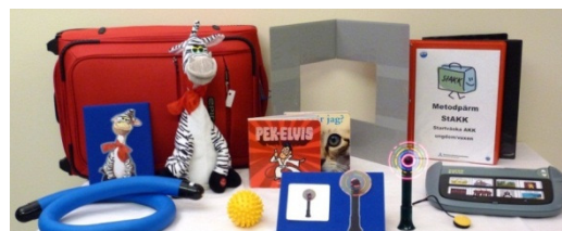
Innehållet i StAKK-väskan för habiliterings-team för ungdomar och vuxna

Materialet i StAKK (Startväska AKK) är uppbyggt för att team skall kunna kartlägga och ge insatser till personer på tidig AKK-nivå. Läs mer om StAKK på www.habilitering.se/stockk .